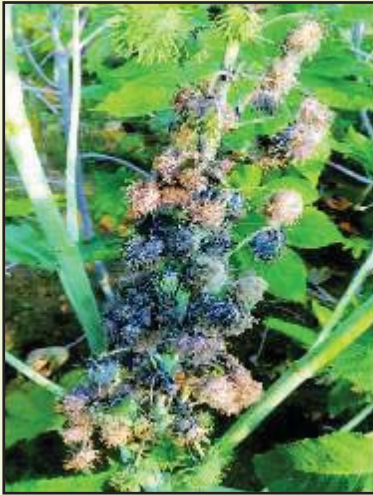
ಕಂದು ಕೊಳೆ ರೋಗ